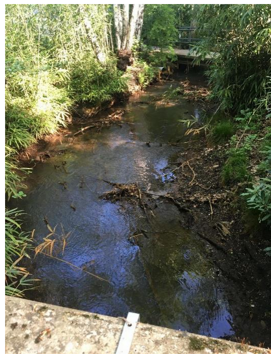
De nood aan een gedifferentieerd captatieverbod weerspiegelt zich op terrein: de waterstand is laag of de beek staat bijna droog. (Laarse Beek te Brasschaat op 27 april 2020 (rechts) en op 6 maart 2020 (links))